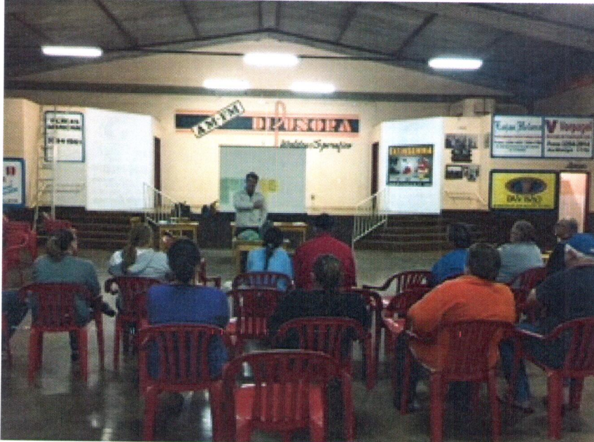
Créditos: Luana Elisa da Silveira Brandt