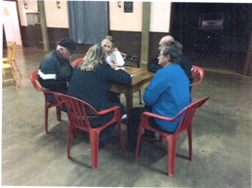
Créditos: Luana Elisa da Silveira Brandt