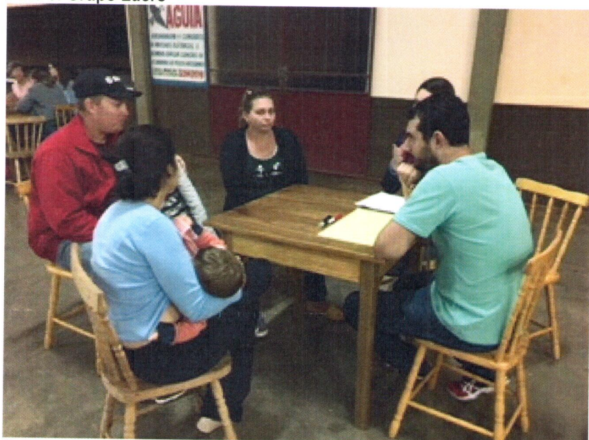
Créditos: Luana Elisa da Silveira Brandt